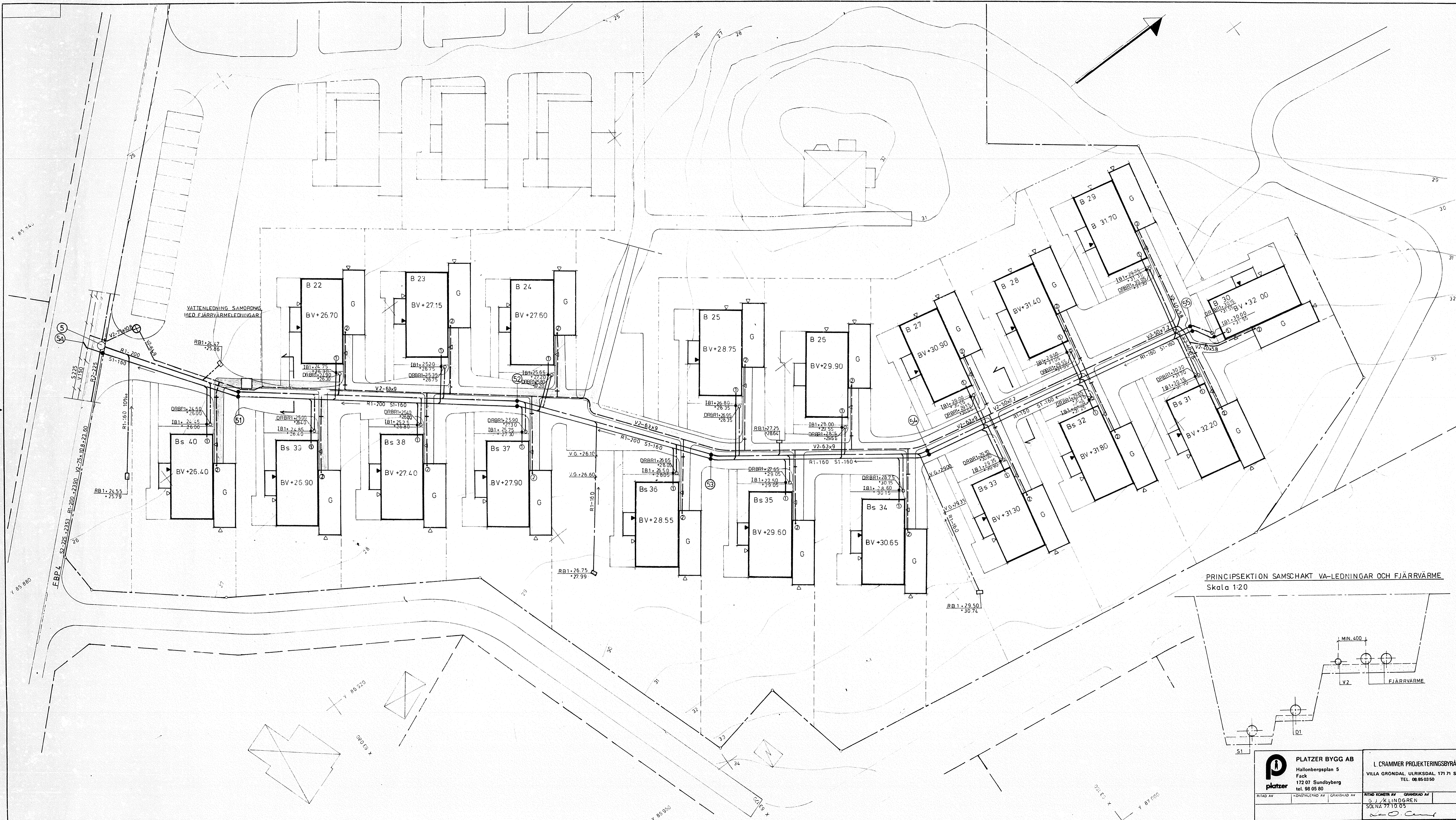
PRINCIPSEKTION SAMSKAFT VA-LEDNINGAR OCH FJÄRRVARME Skala 1:20